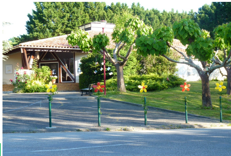
Lectures au jardin—18 mai 2014